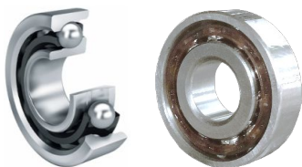
A contatto obliquo