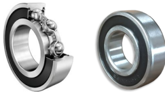
Radiali schermati 2RS Tenute in NBR