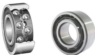
Radiali a due corone