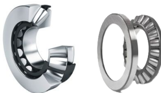
Assiali orientabili a rulli