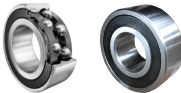
A contatto obliquo a due corone di sfere