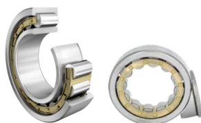
Rulli cilindrici Serie NU