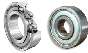
Radiali schermati 2Z (ZZ pte) Tenute in metallo