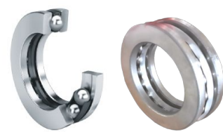
Assiali a sfere