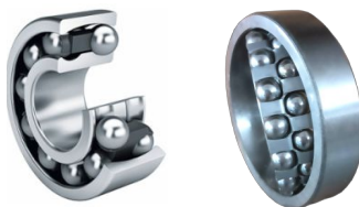
Orientabile a sfere