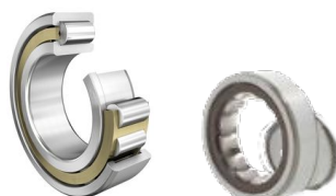
Rulli cilindrici Serie NJ