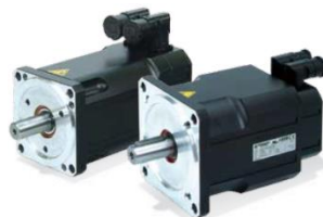
BTD-BCR - brushless