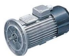
BC - corrente continua