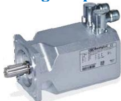
BMD - a magneti permanenti