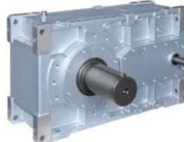
HDO - ad assi ortogonali