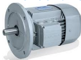
BX - efficienza IE3