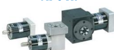
MP e TR