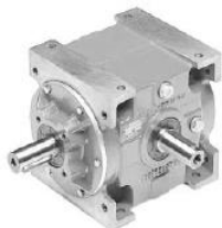
RAN - rinvii angolari