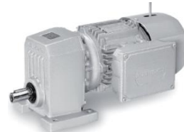
S - monostadio