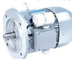
BS - monofase