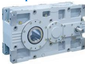
HDP - ad assi paralleli