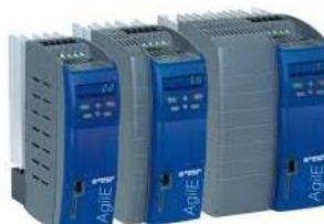
AGILE - alta efficienza