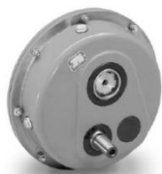
TA - pendolari