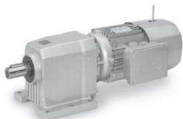
C - coassiali