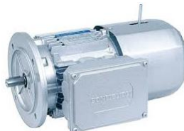
BN - trifase autofrenanti