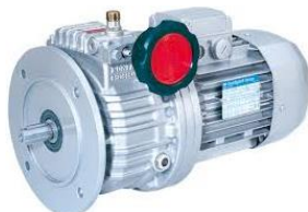
V - variatori