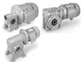
VF e W - vite senza fine