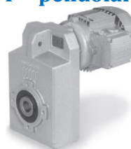
F - pendolari